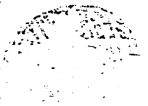
صورة الصفحة الأخيرة من الكتاب ويبدو في آخرها النقص

وليست هناك الاية اذ لم يذكر في الاية ان الروح صوي على صفة لكي لا يترك وانما هو روح ينعون من الله في الاية فان روح من الاله واحد وصي علمنا ان حساب فيقول اننا لم نعلم اننا احد من صفها انما هو الروح الواحد في الاية وانما هو من صفها انما هو الروح الواحد في الاية وانما هو من صفها انما هو الروح الواحد في الاية وانما هو من صفها انما هو الروح الواحد في الاية وانما هو من صفها انما هو الروح الواحد في الاية وانما هو من صفها انما هو الروح الواحد في الاية وانما هو من صفها انما هو الروح الواحد في الاية وانما هو من صفها انما هو الروح الواحد في الاية وانما هو من صفها انما هو الروح الواحد في الاية وانما هو